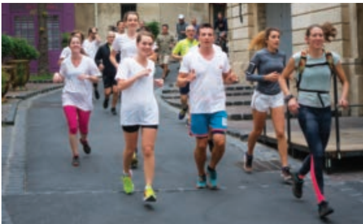
Les courageux coureurs