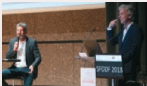
Une conférence inaugurale exceptionnelle