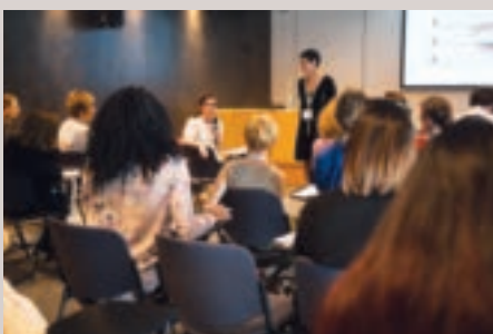
Un auditoire très participatif