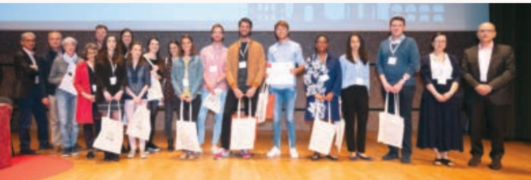
Merci aux auteurs de communications affichées toujours plus intéressantes !

Les presque 600 congressistes ont pu également poursuivre les échanges professionnels et amicaux lors des festivités organisées au sein de la capitale Héraultaise pendant ces trois jours, en se promettant de se retrouver à Nice en 2019 !