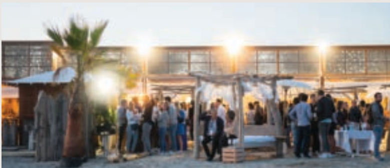
Une soirée à la plage féérique