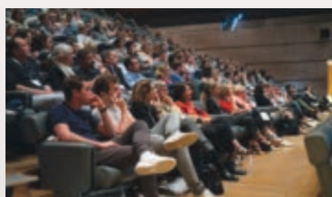
Un auditoire attentif et concentré