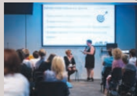
Explications pratiques, mises en scène