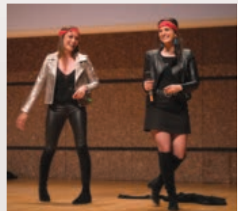
Une totale réussite, le concours d'éloquence !