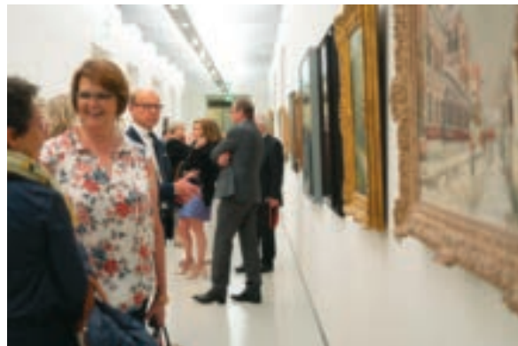
Visite privée du Musée Fabre