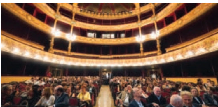
Somptueuse soirée à l'Opéra